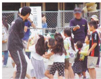
ミニ運動会 (パン食い競争)