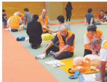
救急法の指導と体験

「質問」 防犯対策指導員は現在何名いるのか。また、どのような実務をしているのか。 答弁 現在1名おり、防犯業務に関する田無警察署との連絡調整等を行っている。