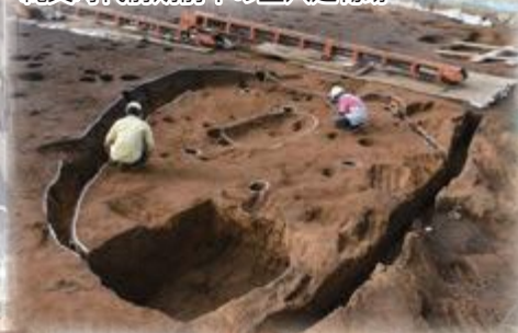
縄文時代前期前半の竪穴建物跡