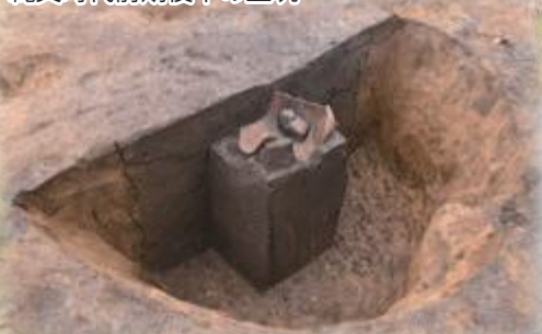
縄文時代前期後半の土坑