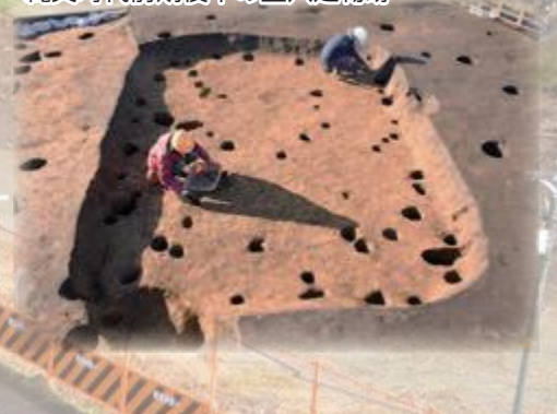
縄文時代前期後半の竪穴建物跡