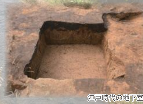
江戸時代の地下室