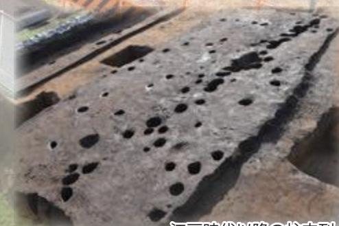
江戸時代以降の柱穴列