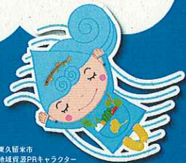
東久留米市 地域推進PRキャラクター あまのつばき あまのつばき