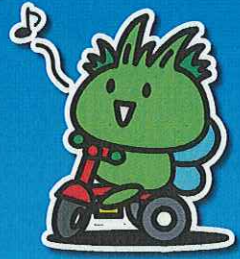
東村山市公式キャラクター ひがっしー