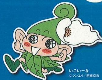
いごいーな @シンエイ / 西東京市