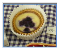
ブルーベリーチーズタルト