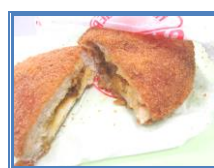
手作りカレーパン