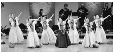
ハワイアンフラダンス

9月17日(土) 午前10時～午後0時20分。 ※入場者多数の場合は、入場を制限する場合があります。生涯学習センター 第1部=祝賀式典 第2部=アトラクション(ピアノ演奏、舞踊、子どもパレエ、歌謡、ハワイアンフラダンス、書道吟、阿波踊り)。手話通訳あり 市内在住の75歳以上の方 福祉総務課高齢者福祉係 470・7777 (内線2508)