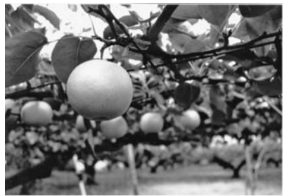
榛名地域特産の梨