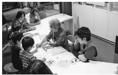
ボランティアの様子

人 募集締め切り後、面談の日程を連絡します。募集要項と応募用紙は、多摩六都科学館で配布するほか、同館ホームページ (http://www.tamarokuto.or.jp) から取得できます 応募用紙に必要事項を記入の上、〒188-0014、西東京市芝久保町5-10-64、多摩六都科学館宛て郵送または直接同館へ持参してください。 ※休館日にご注意ください。 同館 469・6100