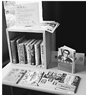
「ひとハコ図書館」のイメージ

9月1日(木)～29日(木)の開館時間中に、市内図書館で配布する所定の用紙でご応募ください。なお、応募用紙は図書館ホームページからも取得できます(中央図書館 475・4646)