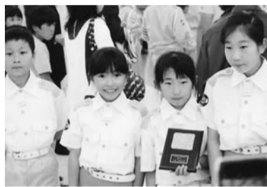
第十小学校の子どもたち

第十小学校の子どもたちが、5位となり、前回大会に引き続き、素晴らしい成績を収めました。