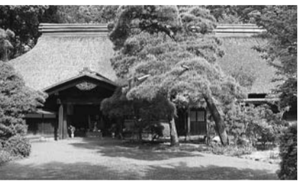
▲村野家住宅の「主屋」

【参加費】600円(資料代、保険代など) 申し込みは4月22日(金)までに(必着、往復はがきに氏名(同伴2人まで連記可)、住所、連絡先電話番号、午前午後の希望と返信用宛名を記入の上、〒203-10044