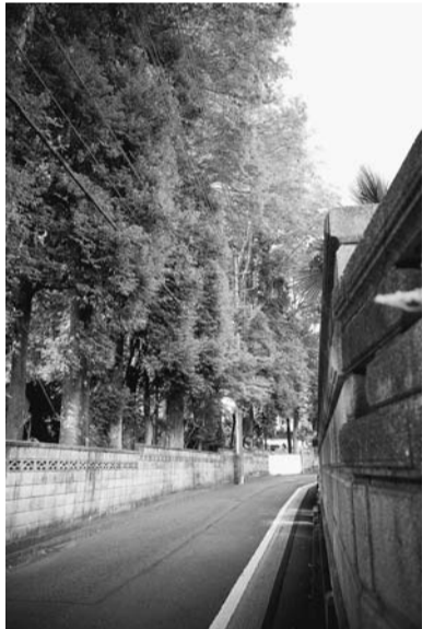
緑の自然が残る柳窪地域

浸水被害のないまちづくりを目指すとともに、大規模地震が発生した場合や今後の施設の老朽化に対しても、機能を確保する事業を進めます。