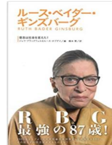
書名：『ルース・ベイダー・ギンズバーグ 信念は社会を変えた！』 著者：シェフ・ブラックウェル&ルース・ホプディ 出版社：あすなる書房 出版年：2020年