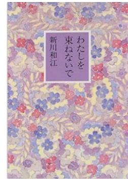
書名：『わたしを束ねないで』 著者：新川和江 出版社：童話屋 出版年：1997