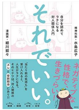
書名：『それでいい～自分を認めてラクになる対人入門』 著者：水島広子、細川貂々 出版社：創元社 出版年：2017年