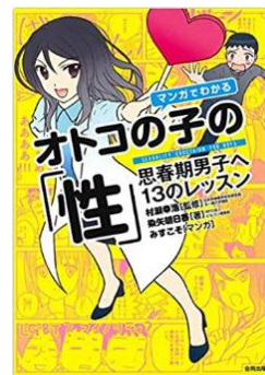
書名：『オトコの子の性』 著者：染矢明日香 出版社：合同出版 出版年：2015年