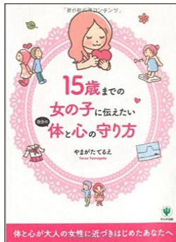
書名：『15歳までの女の子に伝えたい 体と心の守り方』 著者：やまがたてるえ 出版社：かんき出版 出版年：2012年