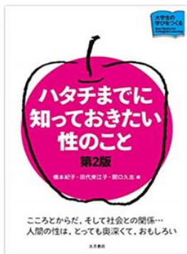
書名：『ハタチまでに知っておきたい性のこと』 編者：橋本紀子、田代美江子、関口久志 出版社：大月書店 出版年：2018年