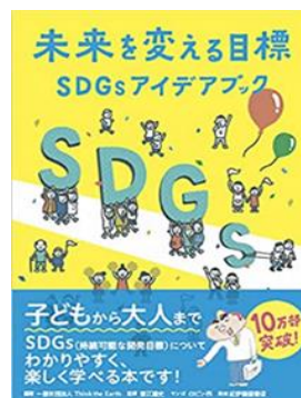
7書名：『未来を変える目標 SDGsアイデアブック』 編者：(一社)Think The Earth 出版社：大月書店 出版年：2018年