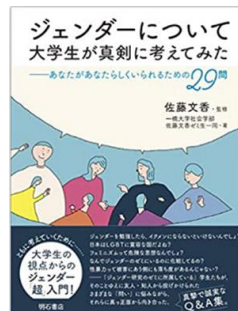
書名：『ジェンダーについて大学生が真剣に考えてみた』 著者：一橋大学社会学部佐藤文香ゼミ生一同 出版社：明石書店 出版年：2019年