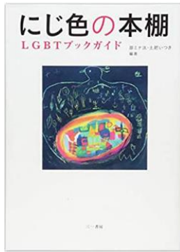
書名：『にじ色の本棚』 著者：原ミナ汰、土肥いつき 出版社：三一書房 出版年：2016年