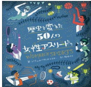
書名：『歴史を変えた50人の女性アスリートたち』 著者：レイチェルイグトフスキー 出版社：創元社 出版年：2019年