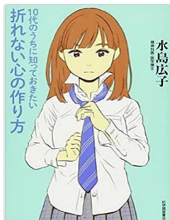
書名：『10代のうちに知っておきたい 折れない心の作り方』 著者：水島広子 出版社：紀伊國屋書店 出版年：2014年