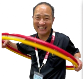
仕事早くてアイデア豊富 嘉喜田副委員長