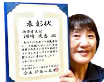
「功労者表彰」 浦崎副委員長