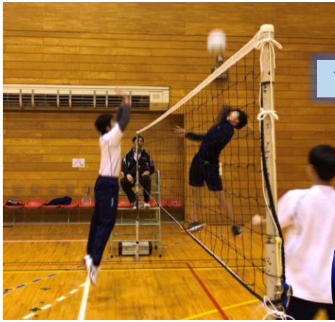
ソフトバレーボール

障がいのある方もない方もだれでも気軽にニュースポーツを楽しむことができます。毎月原則第2土曜日に、スポーツセンターにて（年に数回はわくわく健康プラザ体育館にて）開催。スポーツ推進委員が丁寧に指導します。