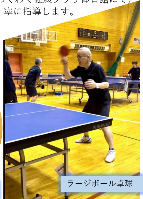
ラージボール卓球