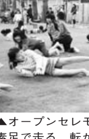
▲オープンセレモニーの後のお楽しみ。素足で走る、転がる、滑り込む。