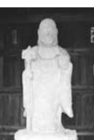
前沢地藏菩薩石像

平成20年10月に、市教育委員会では文化財保護審議会(会長 柳窪五丁目8番 筆子塚(ふでこづか) 所在地:柳窪五丁目8番 墓所内)所有者:個人(共同所有) 筆子塚は江戸時代から明治期にかけて、寺子屋などで手習いを受けた人たちが筆子塚(ふでこ)がその先師の師匠(ししやう)を偲んで造りました。この筆子塚は高さ66cmの石製で、安永四年(1775)に造立された市内最古のものであり、東久留米市の教育の歴史を知るうえで貴重な文化財です。