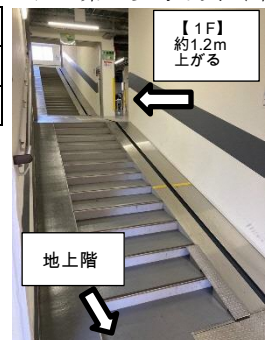
西口第1参考写真(1階)