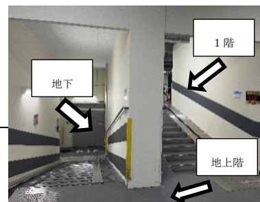
西口第1参考写真（1階・地下）