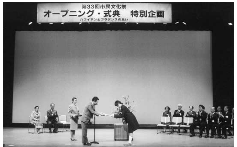
市民文化祭用ポスターに入選した市内中学生の表彰式(昨年)