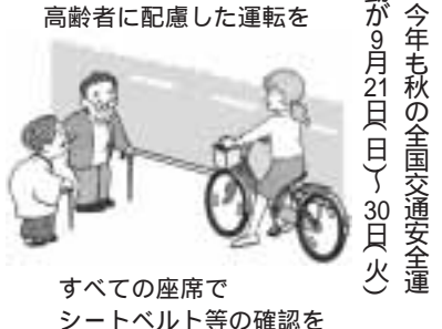
高齢者に配慮した運転を すべての座席でシートベルト等の確認を

6月5日は「環境の日」です。市でも毎年6月に、実行委員会を中心に、市民・事業者の協働による「環境フェスティバル」を開催しています。 【開催】10月24日(水)午後7時~8時半 【会場】中央図書館視聴覚ホール 【内容】中央図書館視聴覚ホールにて、環境フェスティバルの開催について、環境フェスティバルの意義や役割、実行委員会の役割などについて、説明を行います。