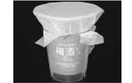
これからの季節にぴったりの清涼感