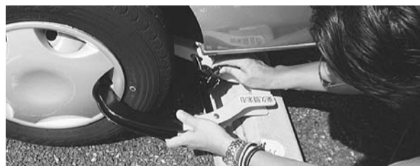
タイヤロック装置や封印を破棄した場合は、刑法第96条の封印等破棄罪が適用されます

※(注1) 搜索とは、国税徴収法第142条に基づく滞納処分で、徴収吏員が滞納者の自宅などで、差し押さえるべき財産を発見するためなどに行う強制調査です。徴収吏員に与えられた最も強い権限で、相手の意思に関係なく、