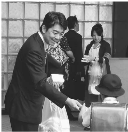
今年5月、市長自ら新人職員とともに「納期内納税キャンペーン」に参加

徴収吏員の持つ最大の強制調査権のひとつに、滞納者側に拒否権のない搜索があり、この強制調査権の行使