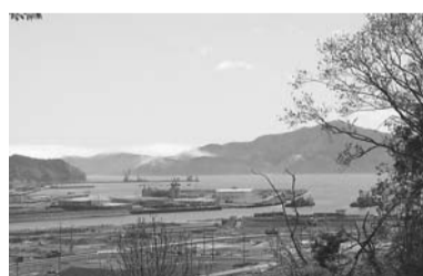
城山(大槌町)からの眺望

月に一度、このコラム欄を通して、日ごろ感じたことなどを、直接市民の皆様へ報告させていただきます。 大槌町への復興支援 東久留米市では、東日本大震災の被災地へ職員を派遣し、復興支援をしてきました。震災直後から開始した短期派遣者は21人、24年度からの岩手県大槌町への中長期派遣者は3人目となっており、先月、職員の激励と派遣先の現状を把握すべく現地を訪問してまいりました。