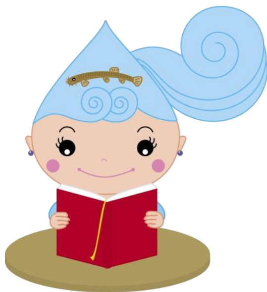
イラスト 使用マニュアル