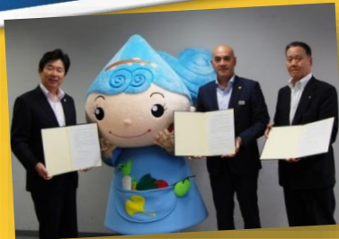
▲産業振興懇談会調印式