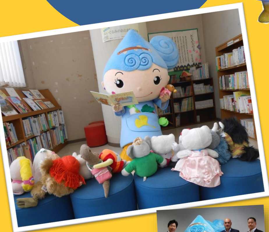
▲ぬいぐるみのお泊り会

産業政策課では、湧水の妖精るるめちゃんの着ぐるみの貸出をしています。 まずは産業政策課まで、空き状況の確認をしてください。