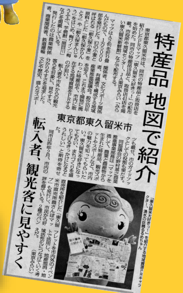
▲特産品マップの駅前配布の際の新聞記事