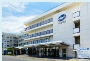
八王子めじろ台 70床