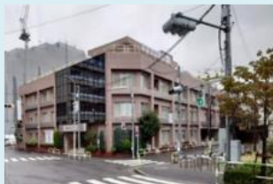
赤羽 95床(うち人工透析10床)