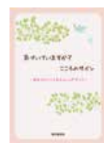
パンフレット表紙

※0570で始まるナビダイヤルは、携帯電話の無料通話、かけ放題プランなどの対象外です。