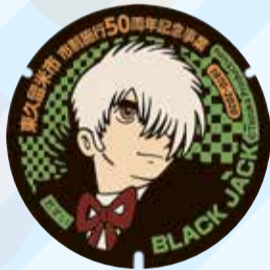
ブラック・ジャック まえさわ小町商店会付近(前沢5-24)