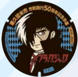
ブラック・ジャック 東久留米市役所(本町3-3-1)