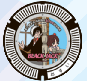
ブラック・ジャック&ピノコ 滝山中央名店会(滝山4-1)