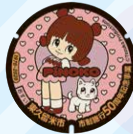
ピノコ 生涯学習センター(中央町2-1)