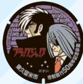
ブラック・ジャック&ドクター・キリコ 東部地域センター(大門町2-10)