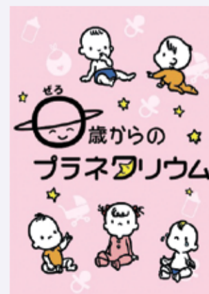
同イベントポスター

日 3月19日(火)午前10時半～11時と11時半～正午 場 多摩六都科学館(西東京市芝久保町5-10-64) 問 0歳から3歳くらいの乳幼児とご家族 各回先着234人 観覧券(展示室+プラネタリウム1回)1,040円(4歳～高校生420円) 注 乳幼児をお連れでない方の観覧はお断りする場合があります 申 当日開館時より同館インフォメーションにて観覧券を販売 問 同館 ☎042・469・6100