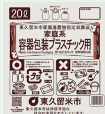
容器包装プラスチック用指定収集袋

市では、昨年10月より容器包装プラスチック用指定収集袋を全世帯へ配布しています。