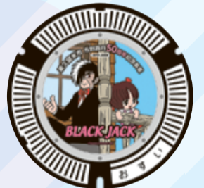
ブラック・ジャック&ピノコ 滝山中央名店会(滝山4-1)