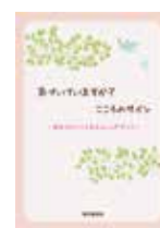
パンフレット表紙

※0570で始まるナビダイヤルは、携帯電話の無料通話、かけ放題プランなどの対象外です。