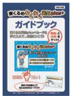
ガイドブック(表紙)