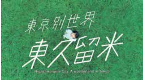
東久留米市プロモーション動画