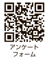
アンケートフォーム

市では、これからも情報提供に努めながら、市民の皆さんと一緒に考えていきます。アンケートフォームから、皆さんのご意見をお聞かせください。※頂いたご意見への個別の対応はできかねますので、ご了承ください。