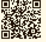
安心くるめーる(市庁)

市の防災行政無線の放送内容、防災情報や防犯情報を知ることができる登録制メール配信サービスです。市内在住の方はもちろん、市外にお住まいの方も登録できます。