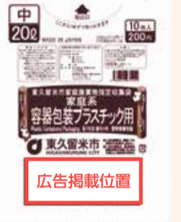
表 広告掲載の規格など

市の家庭廃棄物指定収集袋の外袋に掲載する広告を募集します。店舗や企業などからのご応募をお待ちしています。 規格・枚数・掲載料 1色刷りで、種類別の外袋の表面下部に1枠(6年度の掲載料・申し込み方法などについては、近日中に市HPで公開します) 広告掲載袋の販売期間 6年9月～7年8月(予定) 申込 窓口 042・473・2117へ