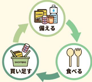
ローリングストックのイメージ

大規模な災害時には、市で備蓄する非常食や飲料水が皆さんに十分に支給されるとは限りません。常備薬、粉ミルク、アレルギー対応の食品など、普段から使っているものは自身で用意しておく必要があります。また、食料品や日用品などは7日分程度のローリングストックによる備蓄が推奨されています。