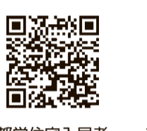
都営住宅入居者募集サイト 都住宅供給公社HP