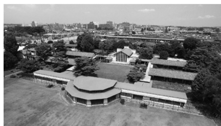
▲選定された建物群の一部(同学園女子部の校舎)

㉑同建物群の詳細などについてが同学園広報本部 ☎428・2122、包括的連携協力協定についてが市企画調整課 ☎470・7702