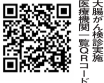
大腸がん検診実施医療機関一覧QRコード

給者、中国残留邦人等支援給付金受給者は、誕生月ごとに受診月が決まっています。特定健診などの受診時に一緒に受けてください。▼受診方法 実施医療機関で直接受診してください。※下のQRコードから市ホームページで確認できます。☎便潜血検査2日法(検便検査)。※内視鏡検査ではありません。☎市内在住の3年3月末で40歳以上の方。ただし、次の①と②に該当する方は、受診前にかかりつけ医にご相談ください。①現在、大腸やその他の腸の疾患で治療中、または経過観察中の方②過去に大腸がんの精密検査で異常を指摘された方。 ※生理中を避けて受診してください。☎500円(受診医療機関でお支払いください)。 ※生活保護受給者等は無料。ただし、受給証明書の提出が必要です。☎検診結果は医療機関で直接お聞きください(郵送は行っていません)。検体を提出しなかった場合でも、自己負担金は返却できませんので、あらか