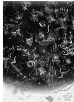
夏の星座イメージ図

変動することがあります） ⑪ 観覧付き入館券1,040円（4歳～高校生は420円） ⑫ 小学2年生以下は保護者と観覧してください ⑬ 当日開館時から観覧券を販売 ⑭ 同館 ☎469・6100