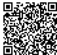
市議会映像配信 QRコード