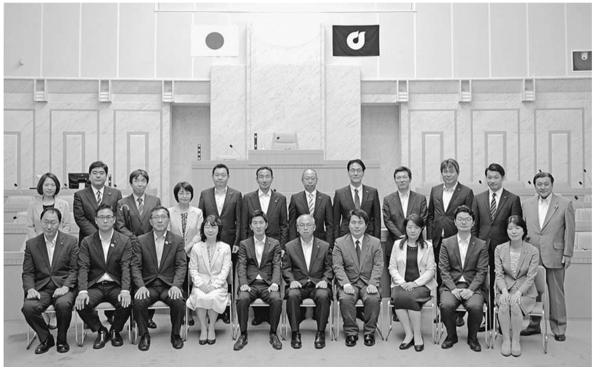
東久留米市議会では節電対策の一環として軽装(クールビズ)での議会運営を実施しています

市議会議員選挙後、初めての議会である令和元年第1回臨時会が、5月16日に開催され、議長および副議長の選挙を行い、議会構成(裏面に掲載)を決定し、新たな市議会がスタートしました。また、同日提出された市長提出議案4件を審議しました。