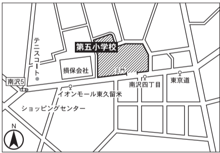
▼第13投票区 第五小学校