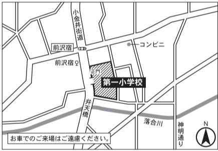
▼第9投票区 第一小学校