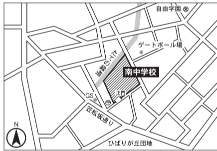
▼第14投票区 南中学校