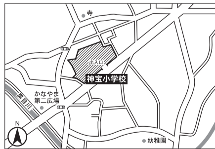
▼第19投票区 神宝小学校