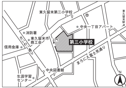
▼第10投票区 第三小学校