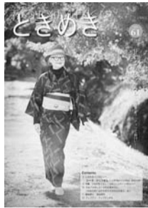
↑男女共同参画情報誌「ときめき」第61号

コーナー紹介、資料コーナー紹介、専門相談案内ほか 配布場所は市民プラザ、男女平等推進センター(市役所2階)、市内公共施設など