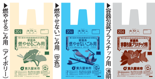
表1 認証保育所一覧

経済的支援を必要とする世帯を対象に、指定収集袋を一定枚数、無料で交付することにより減免を行っています。減免の対象に該当する場合は、次の通り申請してください。 なお、昨年度に減免申請した世帯には「減免のお知らせ」を6月に送付していますので、「ご確認ください」。 詳しくは、「ごみ対策課 ☎473・2117へ」。 【減免の対象】次の①～④のいずれかに該当する世帯 ①生活保護受給世帯 ②身体障害者手帳1・2級、愛の手帳1・2度、精神障害者保健福祉手帳1級のいずれかをお持ちの方が属する非課税世帯 ③児童扶養手当または特別児童扶養手当受給世帯 ④老齢福祉年金受給世帯(老齢基礎年金とは異なります) 【受付期間】7月18日(水)～24日(火)の午前9時～11時50分と午後1時～4時50分(土曜・日曜日は午前9時～正午と午後1時～4時) 【受付会場】市役所2階204会議室 【提出書類】手数料(減額免除)申請書、交付条件に該当することが分かる書類 ※非課税世帯を証明する書類(非課税証明書など)は不要の場合がありますので、同課にお問い合わせください。 【注意】期間内に申請できなかつた方や、年の途中で減免の条件に該当するようになった方は、同課(八幡町2ノ10ノ10)で申請を受け付けます 【その他】今回減免申請した指定収集袋は9月中旬～下旬に交付する予定です