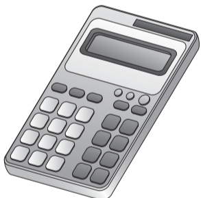
30年度市税などの納期一覧

30年度の市税など(市民税・都民税、固定資産税・都市計画税、国民健康保険税、軽自動車税、後期高齢者医療保険料)の納期限は下表の通りです。 納期限までに市税などを完納していないと、延滞金が増算されるだけでなく、滞納処分が行われる場合もありますので、ご注意ください。 病气・事故・災害など、やむを得ない事情で納付が困難な場合は、できるだけ早めに