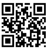
安心くるめーる登録用QRコード

市では市の防災・防犯情報を配信する電子メールの愛称を募集したところ、全国から20件を超える応募を頂き、選考の結果「安心くるめーる」に決定しました。30年1月からこの愛称で配信します。ご応募ありがとうございました。 【登録方法】 次の電子メールアドレス(ahigashikurume@city.higashikurume.lg.jp)で空メール(タイトル、本文は記入不要)を送信してください(右下のQRコードを読み取ると電子メールアドレスの入力が省略できます)。返信される案内に従って登録してください。詳しくは防災防犯課 ☎470・7769へ。