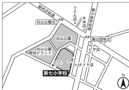
▼第3投票区 第七小学校