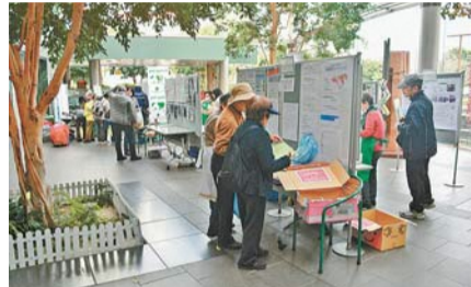
「暮らしフェスタくるめ」昨年の様子

「暮らしフェスタくるめ」は、消費者意識を高め、消費生活の向上を図るために、実行委員会と市の共催で毎年開催しています。 今年「元気に楽しく地域をつなごう」をテーマに、市内で活動する消費者団体のパネル展示を中心に、講演や楽しいイベントなどを行います。ぜひご来場ください。詳しくは生活文化課 ☎470・7738へ。