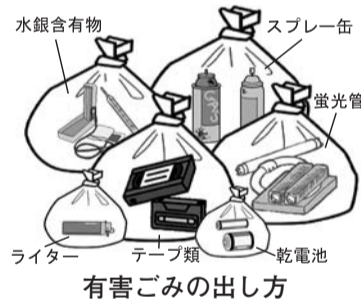
有害ごみの出し方

有害ごみの排出方法 これまで黄色の有害ボックスに排出していた蛍光管などの有害ごみは、戸別収集になります。有害ごみの種類は、