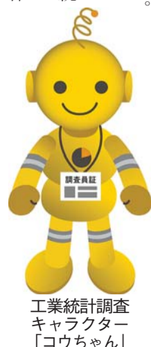
工業統計調査キャラクター「コウちゃん」

工業統計調査は全国の製造業の実態を明らかにするために実施する調査です。今回から、調査日が6月1日になります。5月中旬～6月に調査員が事業所を伺います。従業員が4人以上の事業所は、調査票の回答が必要ですが、詳細は調査員が配布する関係書類をご覧ください。回答していただいた内容は、統計法に基づいて厳重に保護されます。