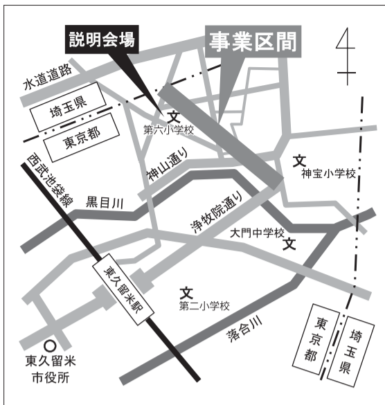
説明会場と事業区間の案内図

都が施行する「東村山3・4・15の1号線(金山町二丁目・氷川台二丁目間)」の事業概要および測量説明会を行います。