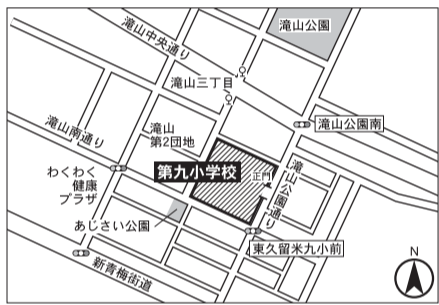
▼第5投票区 第九小学校