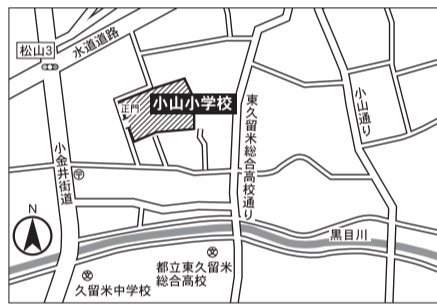
▼第7投票区 小山小学校