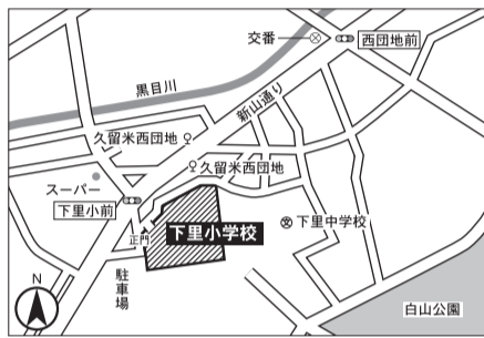
▼第2投票区 下里小学校