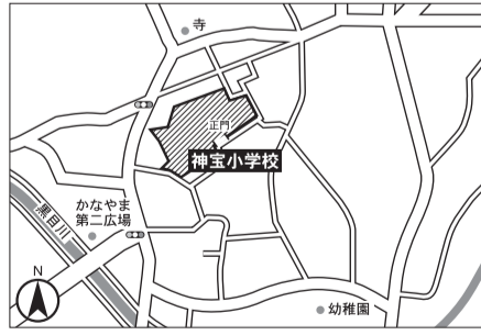
▼第19投票区 神宝小学校