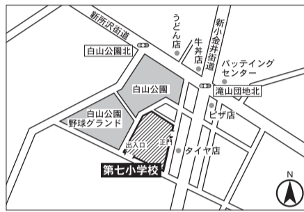
▼第3投票区 第七小学校