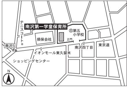
▼第13投票区 南沢第一学童保育所(第五小学校敷地内)