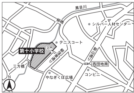
▼第1投票区 第十小学校