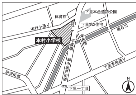
▼第6投票区 本村小学校