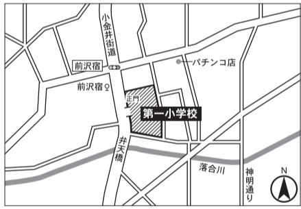
▼第9投票区 第一小学校