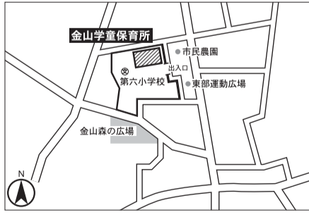
▼第18投票区 金山学童保育所(第六小学校敷地内)