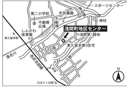
▼第15投票区 浅間町地区センター