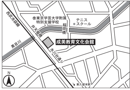
▼第17投票区 成美教育文化会館