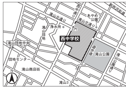
▼第4投票区 西中学校