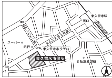
▼第11投票区 東久留米市役所