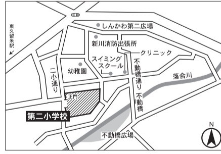
▼第16投票区 第二小学校