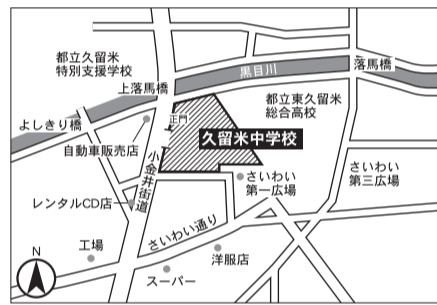
▼第8投票区 久留米中学校