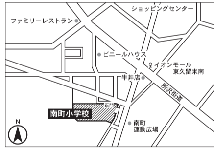
▼第12投票区 南町小学校