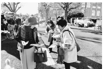
オレオレ詐欺防止キャンペーンのチラシを配布

年暮れにはJOCジュニアオリンピック全国ハンドボール大会東京選抜チームに市内中学生6人が選ばれ、全国大会優勝を果たすという明るい話題もありました。一方、田無警察署管内における特殊詐欺被害(オレオレ詐欺など)の認知件数が3年連続で都内ワーストワンという、不名誉なニュースもあります。多くの市民の方が被害に遭われた許し難い記録です。市内だけの認知件数と被害を見ますと、25年(43件、約9400万円)、26年(34件、約1億8000万円)、27年(24件、約8700万円)と推移しています。