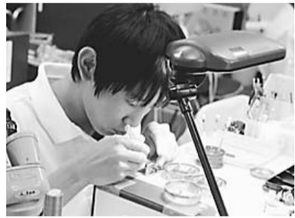
時計の仕組みを見てみよう！

6月13日（土）正午～午後4時 クォーツ式の腕時計を、小さな部品まで分解し組み立てながら、時計の仕組みを見てみましょう ☎高校生以上定20人 ☎シチズン時計株式会社、シチズン時計マニュファクチャリング株式会社 ☎無料（別途入館券が必要） ☎5月29日（金）までに（必着）、同館ホームページ（http://www.tamarokuto.or.jp/）または、はがきに開催日・イベント名・郵便番号・住所・氏名・年齢（学年）・電話番号を記入の上、〒188-0014、西東京市芝久保町5-10-64、多摩六都科学館宛て郵送を ☎同館 ☎469・6100（月曜日休館。ただし5月4日は開館し、7日が休館）