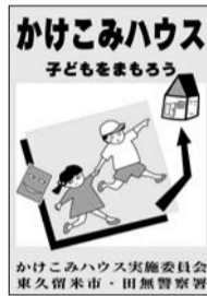
かけこみハウス標識