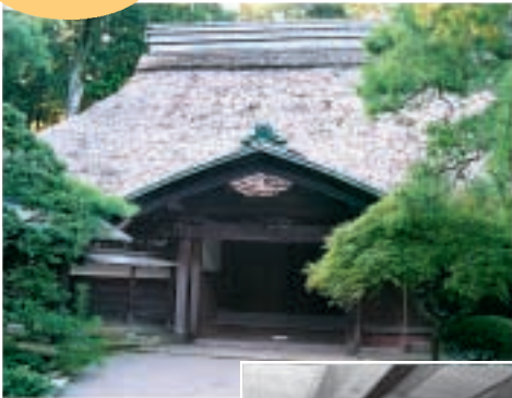
式台 後で付けられたとおもわれる

柳窪には、江戸時代から明治にかけての古民家が 多く残っています。萱葺き民家は江戸時代後期の ものが1軒です。明治初期に建てられた民家も多 く、外観は屋根などが改築されているものの、な かに入ると当時の太い柱や梁は健在で、どっしり とした時代の重みを感じさせてくれます。