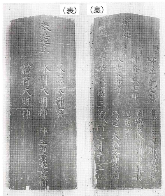
▲承応三年の年号の記された氷川神社棟札

市内南沢の氷川神社（旧南沢村）に所蔵されているこの棟札（注）は縦58cm、横22,4cm、厚さ3cmの木製に文字は陰刻で全体が茶褐色の漆で仕上げられている。これは市内の社寺に現存