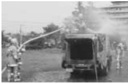
ごみ収集車の消火作業をする消防隊員

9月2日、南町二丁目都営東原住宅公園横清掃施設にて清掃車が不燃ごみを収集中に爆発炎上事故が発生しました。