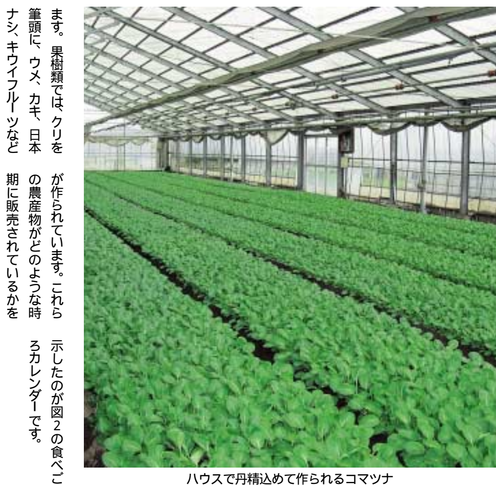
ハウスで丹精込めて作られるコマツナ