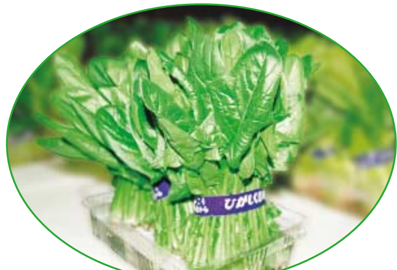
地場産のほうれんそう

を果たしています。今更の一面でも掲載しています。その後継者の方も誇りを持ち、農産物の生産に取り組まれています。東久留米市の農業を発展させ、農地を保全していくことも大切な東久留米産の農作物を育てるだけでなく利用