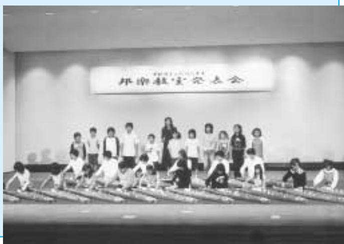
練習の成果を、さあ、発表です！（昨年の発表会より）

公民館では土曜日に小・中学生の皆さんを対象とした琴・三味線・尺八の邦楽教室を開催します。日本の伝統音楽を楽しんでみませんか。 【日程】下表の通り 【対象】市内在住・在学の小学4年生～中学生 【講師】東久留米市邦楽連盟の方ほか 【定員】40名（応募多数の場合は抽選。受講案内は、はがきで連絡します。） 【参加費】1000円（教材費）