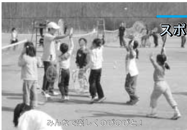
みんなで楽しくのびのびと！