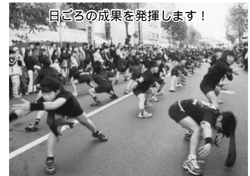
市民みんなのまつり出演プログラム