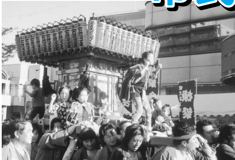
みこしの登場でまつりがさらに盛り上がります!

秋も深まり、いよいよまつりの季節です。今年も、市民みんなのまつり、農業祭・商工祭を11月13日(土)正午からと14日(日)午前10時から2日間、盛大に開催します。会場は、東久留米駅西口から市役所間(歩行者天国)、市民プラザと西口北公園などで雨天決行。展示会や市の特産品、姉妹都市・榛名町の特産品の即売会、各種模擬店、特別コーナーなどを開きます。また、市民による郷土芸能の披露、子ども向けのキャラクターショーなどステージも盛りだくさんの催しを予定しています。ぜひお出掛けください。 詳しくは同まつり連絡協議会事務局・JA東京みらい東久留米支店 ☎75・0027 または産業振興課 ☎70・7743へ。