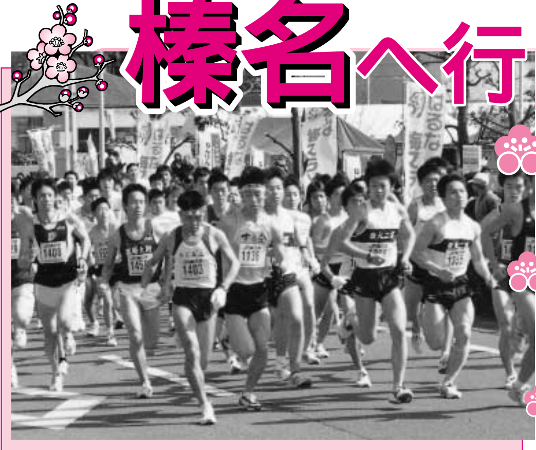
榛名の大自然の中を駆け抜けます(昨年の「はるな梅マラソン」より)

姉妹都市・榛名町は、榛名山を背景に広がる群馬県中西部の中山間地帯に位置しています。今年、榛名町50周年記念事業として、「はるな梅フェスタ」が盛大に開催されています。恒例のはるな梅マラソンなど、イベントが盛りだくさん。そこで今号では、榛名町の楽しみ方として榛名湖の冬の風物詩に加え、「はるな梅フェスタ」を紹介してみませんか。ぜひこの機会に、家族や友人と榛名町を訪れてみてください。詳しくは生活文化課 ☎70・7738へ。