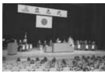
将来の自分自身へ「誓い」を発表!

立志式は、子どもから大人へと成長する過程にある14歳の立春に合わせて、自分が進むべき将来を真剣に考える機会をつくることと始め